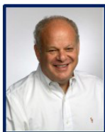
Martin E. P. Seligman Optimismo aprendido