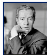
Juan Rulfo Y más allá, una línea de montañas...